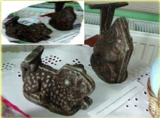
Fot. Formy żelwne do wypieków

Przyozdobiony czerwoną chorągiewką z napisem „Alleluja” był symbolem zmartwychwstania Chrystusa oraz triumfu życia nad śmiercią.