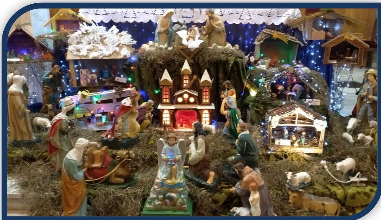
Wystawa szopek bożonarodzeniowych w kościele parafialnym

Jest jeszcze prawie 60... Rozsiane po naszych domach niejako przedłużają ten żłobek z naszego kościoła. To dzieło dzieci klas 4-6, które z różnych materiałów, według własnej koncepcji ilustrowały EWANGELIĘ o BOŻYM NARODZENIU.